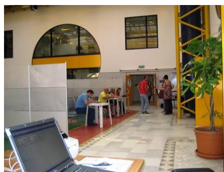
Alcuni avisini mentre compilano il questionario

SE HAI COMPIUTO 18 ANNI TI ASPETTIAMO, PORTA CON TE UN DOCUMENTO D'IDENTITA' E LA TESSERA SANITARIA QUELLA VECCHIA CON IL NUMERO. SARAI ACCOLTO CON CORDIALITA' E SIMPATIA DAI VOLONTARI AVIS. SE VUOI DIVENTARE ANCHE TU UN VOLONTARIO, PARLANE CON LORO. CIAO TI ASPETTIAMO.