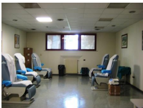
La sala per effettuare le donazioni