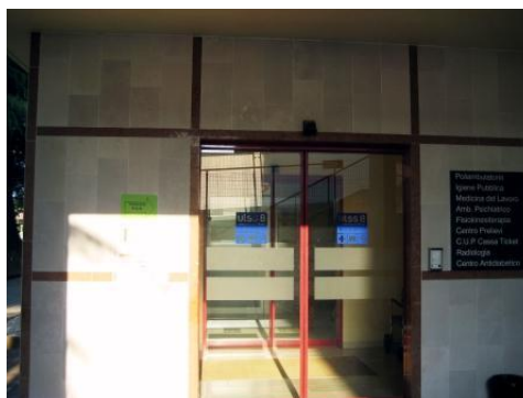
L'entrata del Poliambulatorio di Crespano