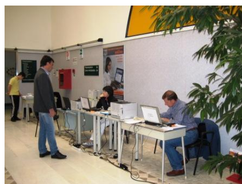
La Segretaria al Punto presentazione