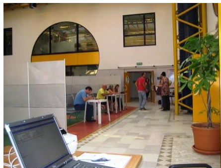
Alcuni avisini mentre compilano il questionario

SE HAI COMPIUTO 18 ANNI TI ASPETTIAMO, PORTA CON TE UN DOCUMENTO D'IDENTITA' E LA TESSERA SANITARIA QUELLA VECCHIA CON IL NUMERO. SARAI ACCOLTO CON CORDIALITA' E SIMPATIA DAI VOLONTARI AVIS. SE VUOI DIVENTARE ANCHE TU UN VOLONTARIO, PARLANE CON LORO. CIAO TI ASPETTIAMO.