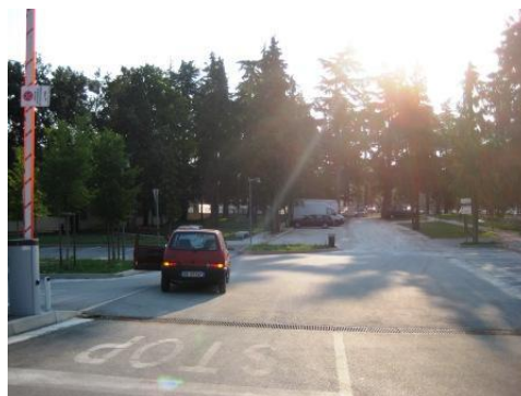
Come si arriva al centro donazioni di Crespano