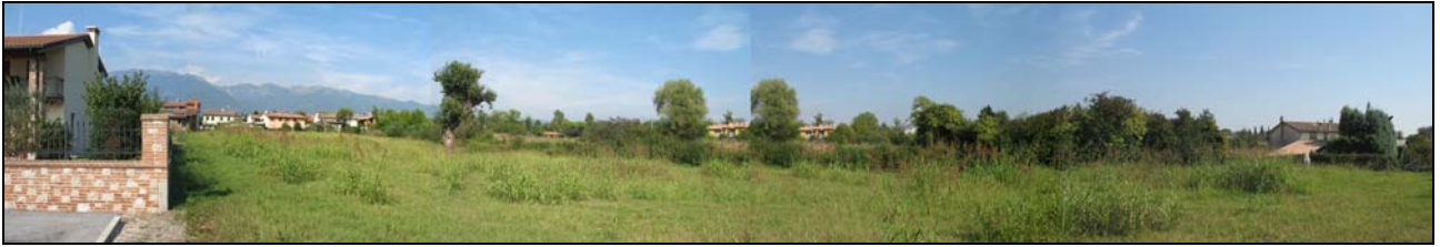
Foto 02 Vista verso nord-est da via XXV Aprile