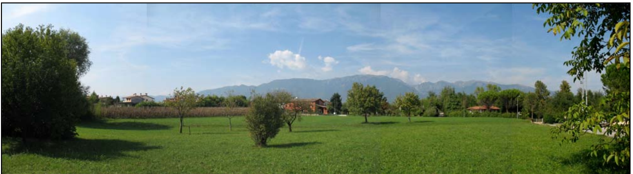
Foto 05 Vista verso nord-ovest