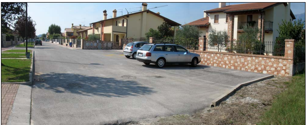
Foto 01 Vista verso ovest lungo via XXV Aprile