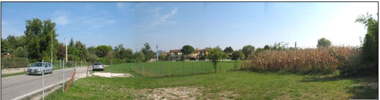
Foto 04 Vista verso est lungo via Belli