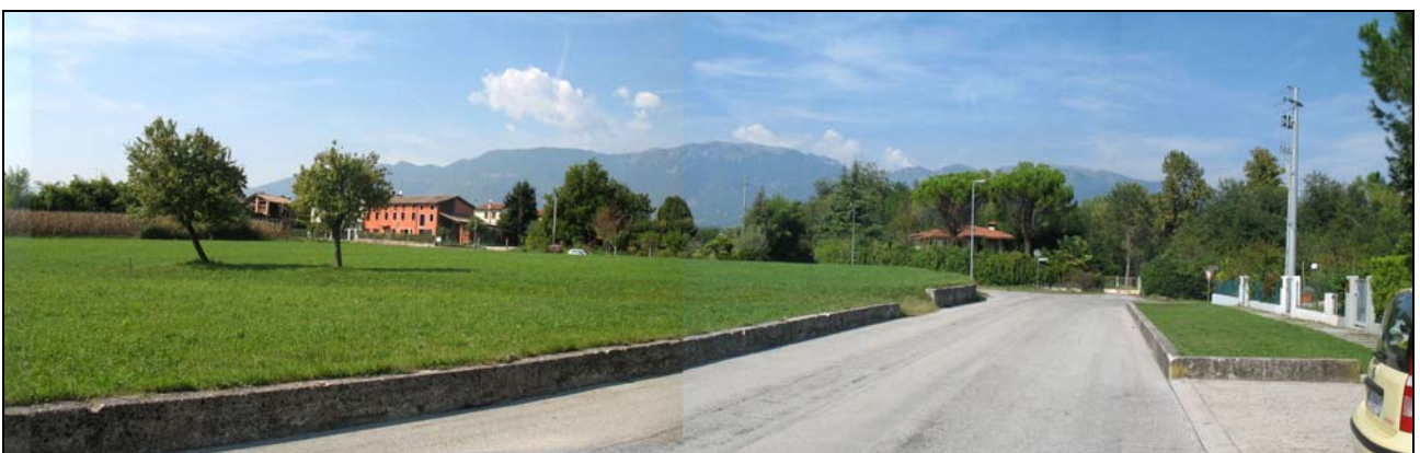
Foto 06 Vista verso nord lungo via S. Martino